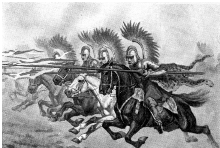
Ilustracja z podręcznika szkolnego

Twoja praca powinna zająć co najmniej połowę wyznaczonego miejsca.